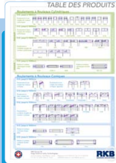
Table des produits

Introduction générale du groupe suisse RKB: Historique et grandes étapes, Présence Mondiale, Expérience Industrielle, Technologie de Production et Automatisation, Certifications Qualité, Ingénierie et Assistance Technique, Réseau Logistique Global.